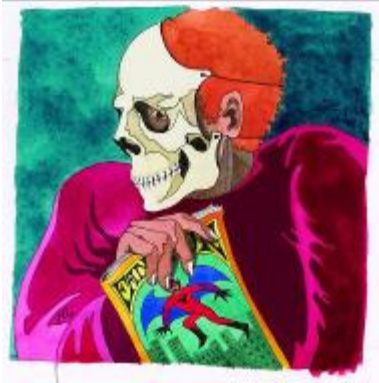
Reinzeichnung zu Die drei ??? und die Comic-Diebe

© Franckh-Kosmos Verlags-GmbH & Co. KG, Stuttgart, Illustration von Aiga Rasch