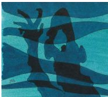
Reinzeichnung zu Die drei ??? Und der Phantomsee

© Franckh-Kosmos Verlags-GmbH & Co. KG, Stuttgart, Illustration von Aiga Rasch