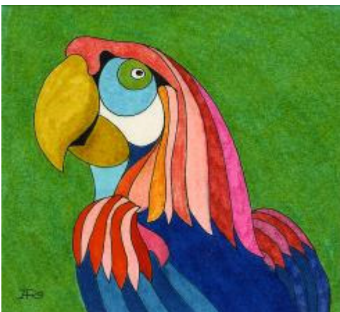
Reinzeichnung zu Die drei ??? und der Super-Papagei

© Franckh-Kosmos Verlags-GmbH & Co. KG, Stuttgart, Illustration von Aiga Rasch