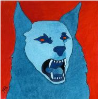
Reinzeichnung zu Die drei ??? und der Karpatenhund

© Franckh-Kosmos Verlags-GmbH & Co. KG, Stuttgart, Illustration von Aiga Rasch