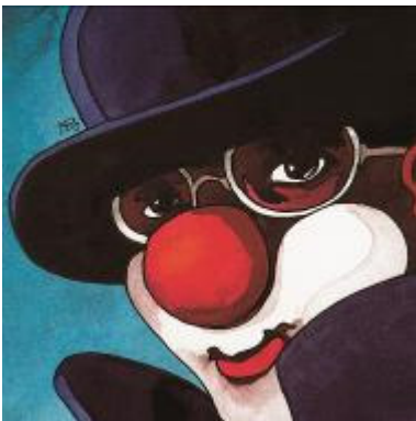
Reinzeichnung zu Die drei ??? Tatort Zirkus

© Franckh-Kosmos Verlags-GmbH & Co. KG, Stuttgart, Illustration von Aiga Rasch