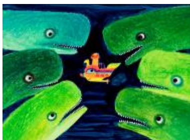
Innenillustration aus Das U-Boot Fritz , Boje Kinderbuch, 1977

© Franckh-Kosmos Verlags-GmbH & Co. KG, Stuttgart, Illustration von Aiga Rasch