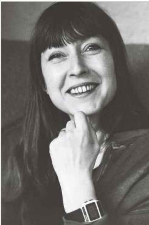
Porträt von Aiga Rasch

Bitte beachten Sie, dass eine genehmigungs- und vergütungsfreie Nutzung dieser Pressebilder ausschließlich im Rahmen aktueller Berichterstattung zur Ausstellung Die drei ??? - Aiga Rasch und das Mysterium der Bilder unter Nennung der Bildangaben des Copyright-Vermerks „ Die drei ??? © Franckh-Kosmos Verlags-GmbH & Co. KG, Stuttgart, Illustrationen von Aiga Rasch “ zulässig ist. Gerne senden wir Ihnen die Bilddateien kurzfristig in druckfähiger Qualität zu. Richten Sie Ihre Anfrage hierzu an stadtmuseum@langenfeld.de .